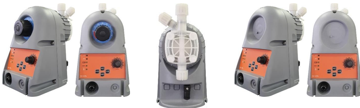
FX C/A s nastavením zdvihu